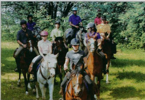
L'équitation est un sport complet qui multiplie les bénéfices pour la santé.

Le sentiment de liberté est réel. « Quand je suis au club, ma tête se vide de toute la liste de ce que j'ai à faire, je me mets en mode cheval, explique une cavalière. Je ne pense qu'à mon cheval depuis le moment où je vais le chercher jusqu'au moment où je le quitte, tranquille dans son écurie à machouiller son foin. » Cette faculté de captation du cheval en fait un exceptionnel loisir pour tous ceux qui doivent gérer le stress au quotidien.