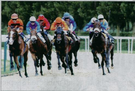
Les centres équestres ont été reconnus comme faisant partie du secteur agricole.

Les métiers de l'enseignement et de l'animation sont ceux qui offrent le plus de possibilités. Ils ouvrent souvent la porte à tous les autres en formant à la communication et à l'envie d'aller vers les gens. Ce sont des